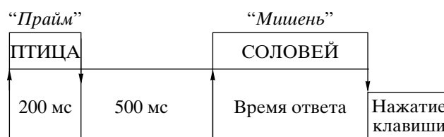
Рис. 1. Схема процедуры исследования.

Одной половине испытуемых предлагалось нажимать клавишу “1” при соответствии “прайма” и “мишени” и нажимать клавишу “2” при их несоответствии, другой половине – нажимать клавишу