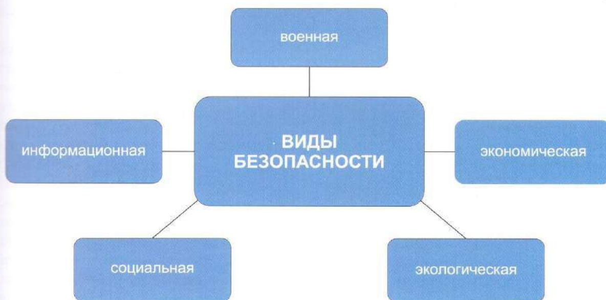
Рис. 1. Виды безопасности

рушения его персонального пространства, от угрожающих жизни и здоровью факторов. Социальная и экономическая безопасность гарантируют стабильность взаимодействия в социуме, обеспечивают эффективность этого взаимодействия как приносящего человеку материальные дивиденды, определяющего экономическое благополучие в настоящем и в отдалённой перспективе.