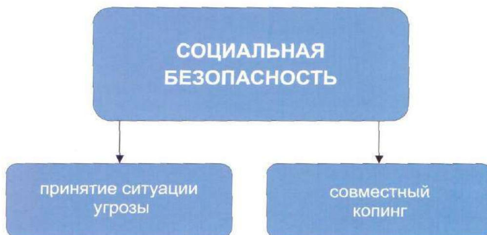
Рис. 2. Способы восстановления социальной безопасности

(прямая или косвенная) может исходить от самого близкого человека.