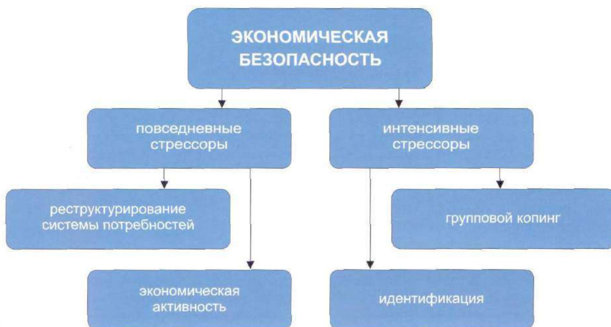
Рис. 3. Способы восстановления экономической безопасности

леть теми же самими средствами, что и повседневные экономические трудности. Однако обращение к социальной поддержке, групповому копингу, социальным формам совладания с кризисными ситуациями помогает восстановить нарушенное состояние безопасности и обрести уверенность в результативности предпринимаемых усилий по улучшению своего экономического статуса.