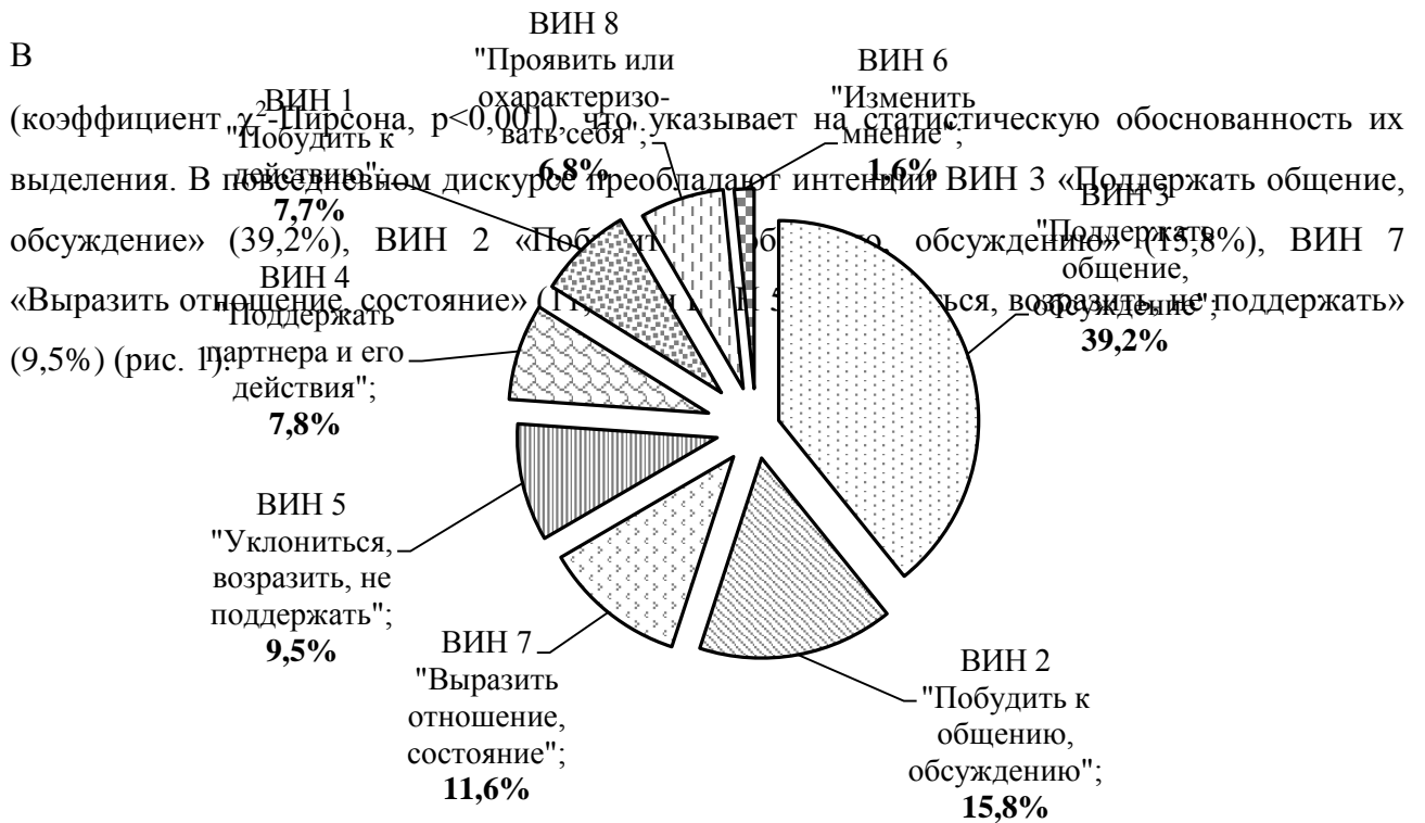
Рис. 1. Относительная выраженность ведущих интенциональных направленностей дискурса (в % от общего количества выявленных интенций, n=2299 ).

Представленные данные обнаруживают приоритетную направленность дискурса на поддержание, развитие коммуникации (интенции ВИН 2 и ВИН 3) и регуляцию межличностных отношений (интенции ВИН 4 и ВИН 5). Выявлена его эмоциональная насыщенность, на что указывает значительная выраженность интенций ВИН «Выразить отношение, состояние» («выразить радость», «выразить недовольство» и пр.).