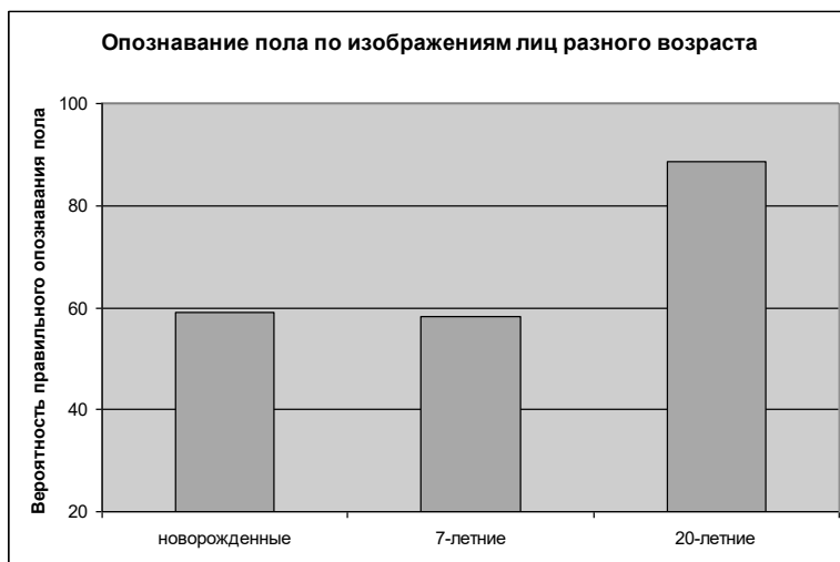
Рис. 1. Изменение вероятности правильного опознавания пола по лицам новорожденных младенцев, 7-летних детей и 20-летних юношей и девушек всеми испытуемыми.

В первом эксперименте мы сравнивали вероятность правильного опознавания пола по лицам детей разного возраста, а также юношей и девушек. Полученные результаты представлены на рисунке 1.