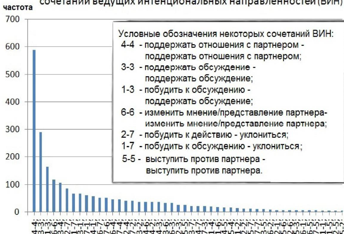
Абсолютные частоты встречаемости различных сочетаний ведущих интенциональных направленностей (ВИН)

он, хотя и довольно широк, свидетельствует о направленности на партнера: побудить в пользу высокой вероятности совпадения его к действию, обсуждению, поддержать с результатов экспертизы с интент-анализом: