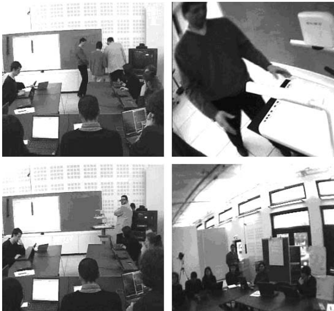
Рис. 2. Изображения двух ситуаций, записанных внешней фиксированной камерой (слева) и SubCam (справа). Инструментом экипирован участник совместной деятельности, находящийся рядом с телевизионным экраном (на кадрах слева – в светлом пиджаке)

Многолетний опыт применения метода позволяет сделать вывод, что если участник доверяет исследователям и оборудованию, его наблюдаемое поведение можно считать спонтанным и естественным. Именно поэтому важнейшей фазой проведения исследования должна быть подготовка, обеспечивающая соответствующий уровень доверия. Уважение участника исследования является не простым этическим требованием, а необходимым условием получения надежного эмпирического материала. Следует особо настаивать на этой позиции, чтобы воспрепятствовать «дикому», но заманчивому применению инструмента. Это тем более опасно, что сами участники могут не представлять уровень моральных и психологических последствий несанкционированного ими использования получаемых при помощи SubCam данных.