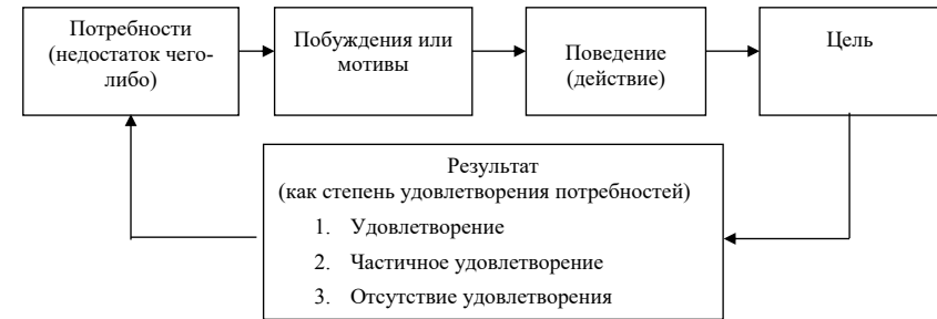
Рис. 1. Модель удовлетворения потребностей (источник: Мескон, Альберт, Хедоури, 1992)

Так, экономическое самообеспечение даже тогда, когда формирование экономического достатка осуществляется главным образом трудом в традиционном понимании, все равно не сводится к труду, а является хозяйственной деятельностью по рациональной организации имеющихся у личности доходов, имущества, с помощью ко-