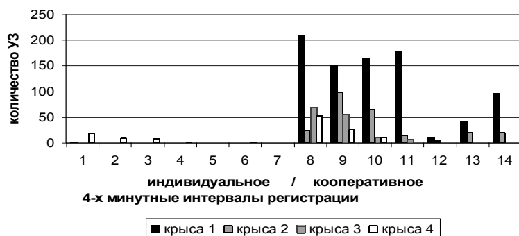
Рис. 1. УЗ-вокализация в индивидуальном и кооперативном поведении. Данные для четырех крыс из двух пар в первой индивидуальной и первой кооперативной сессии.

Проанализирована УЗ-вокализация в индивидуальном и кооперативном инструментальном пищедобывательном поведении у 14 крыс (7 пар). В индивидуальном поведении крысы издавали УЗ крайне редко. На рисунке 1 видно, что во время индивидуального поведения – первые семь 4-минутных эпох, на которые была разбита 30-минутная сессия для анализа динамики – все четыре крысы из одной серии экспериментов почти молчали, а в поведении сообща (эпохи 8–14) у всех