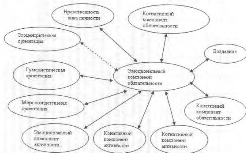
Рис. 2. Корреляционные взаимосвязи эмоционального компонента стратегии обязательности соблюдения нравственных норм с другими элементами нравственного самоопределения (сплошные стрелки – положительные, пунктирные – отрицательные взаимосвязи)

Можно заметить, что наиболее плотные связи между элементами и наибольшее их количество присутствуют в факторе « Нравствен-