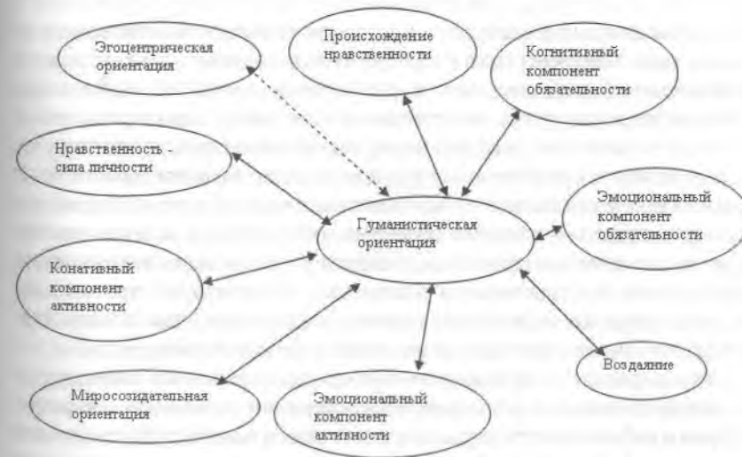
Рис. 3. Корреляционные взаимосвязи гуманистической нравственной ориентации с другими элементами нравственного самоопределения (сплошные стрелки – положительные, пунктирные – отрицательные взаимосвязи)

ная активность». В частности, наибольшее число связей с другими элементами имеет «эмоциональный компонент обязательности соблюдения нравственных норм» (10 связей) (рисунок 2), немного отстает от него (9 связей) – «гуманистическая ориентация» (рисунок 3), на третьем месте (8 связей) – показатели «нравственность – сила личности» (рисунок 4) и «эмоциональный компонент активности», на четвертом месте – «миросозидательная ориентация» (7 связей). Фактор « Нравственно-нормативные убеждения » по числу связей между элементами находится на втором месте. В частности, наибольшее число связей с другими элементами имеют показатели «воздаяние за добро и зло», «когнитивный компонент обязательности соблюдения нравственных норм» и «эгоцентрическая ориентация» (по 6 связей). Элементы фактора « Взаимость нравственного поведения » имеют мало связей с элементами других факторов и еще меньше – между собой. Элементы фактора « Нравственно-мировоззренческие убеждения » имеют значимые связи с элементами других факторов и между собой, например, с элементами фактора « Нравственная активность », в частности с миросозидательной ориентацией.