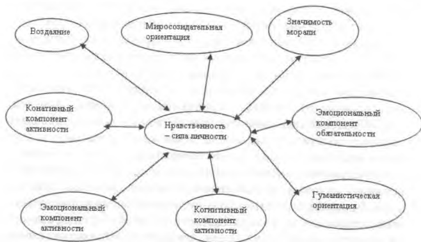
Рис. 4. Корреляционные взаимосвязи представления о нравственности как показателе силы или слабости личности с другими элементами нравственного самоопределения (все взаимосвязи положительные)

Обобщая данные факторного и корреляционного анализа, можно сделать заключение, что в структуре нравственного самоопределения имеются наиболее значимые элементы, тесно связанные с другими, которые могут быть отнесены к «стержню» самоопределения. Такими элементами выступают нравственные ориентации и некоторые базовые нравственные убеждения. В то же время факторный анализ позволил выявить определенные «зоны» или «секторы» самоопределения, в которых объединены элементы определенного функционального назначения, например, связанные с активностью личности или принципами поведения. В этих зонах присутствуют как элементы «оболочки» (правила поведения), так и элементы «стержня» (нравственные ориентации и базовые убеждения).