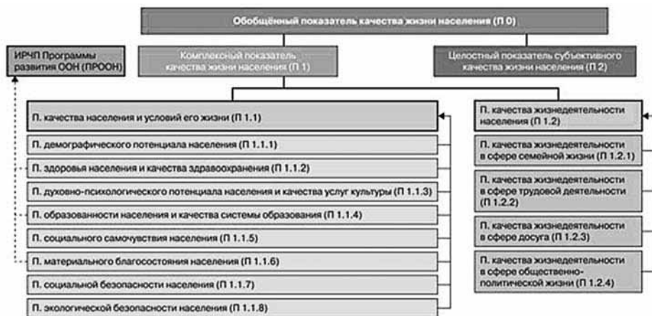
Рис. 2. Структура показателей качества жизни