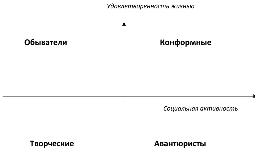
Рис. 2. Стили в пространстве двух факторов

Положительные корреляции общей удовлетворенности жизнью с материальным благосостоянием имеют следующую структуру. Так как удовлетворенность жизнью и отдельными сферами – это когнитивное суждение о ситуации и зависит от ожиданий, стремлений, представлениях о стандарте референтных групп, то неудовлетворенность респондентов «авантюрного» стиля, возможно, объясняется несоответствием ситуации и ожидания (низкая оценка материального благосостояния в реальности и высокая в идеале). Неудовлетворенность людей «творческого» стиля не объясняется неудовлетворенностью материальным благосостоянием (низкая оценка его в реальности и низкая в идеале). Большой вклад вносят необщительность, неуверенность в себе и др. Удовлетворенность «обывателей» можно объяснить удовлетворенностью материальным благосостоянием (высокая оценка его в реальности и высокая в идеале).