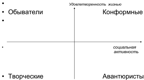
Рис. 2. Стили в пространстве

и высокие — духовности, образования и т. д.