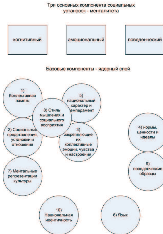
Рис. 1. Структура менталитета

людей определенной эпохи, географической области и социальной среды, особый психологический уклад общества, влияющий на исторические и социальные процессы.