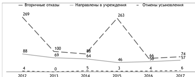
Рис. 1. Проблемы сиротства в г. Санкт-Петербурге в 2012–2017 гг. (Агапитова, 2017)

Из 1036 детей, взятых под опеку, в замещающие семьи или усыновленных в 2015 г. в г. Санкт-Петербурге, 57 были возвращены в детские дома, что составляет 5,5% от общего числа сирот, которые прошли через устройство в семьи. По мнению детского омбудсмена, это является результатом того, что специалисты не научились выявлять на раннем этапе неблагополучие в замещающей семье.