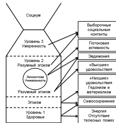
Рис. 1. Личностно ориентированная концепция счастья

В период 2006–2010 гг. мы разработали личностно ориентированную концепцию счастья (ЛОКС), основывающуюся на идее о биопсихосоциальном единстве человека (см. рисунок 1). ЛОКС синтезирует два основных подхода – эвдемонический и гедонистический – в современных исследованиях психологии счастья, а также обладает интегрирующей силой в отношении ряда теорий личности начала – середины XX столетия (Левит, 2011а, 2011б, 2012а, 2012б, 2012в).