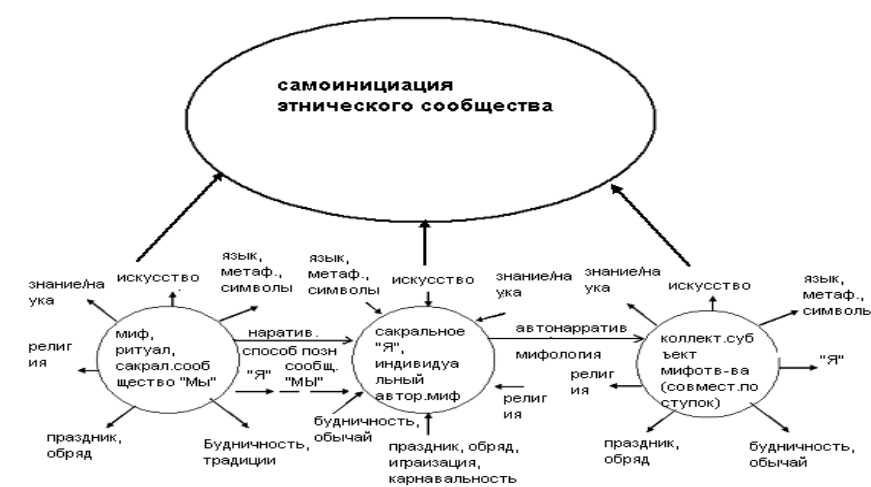
Рис. 1. Мифотворчество и наррадигма как способ методологизации

Суть этой модели – миф и нарратив как исконные и непреходящие составляющие человеческой психики, душевности и духовности (Татенко, 2006) Эвристическая ценность предлагаемой модели – в возможности с их помощью методологизировать многомерный объект исторической психологии в предметной области человеческого «Я»,