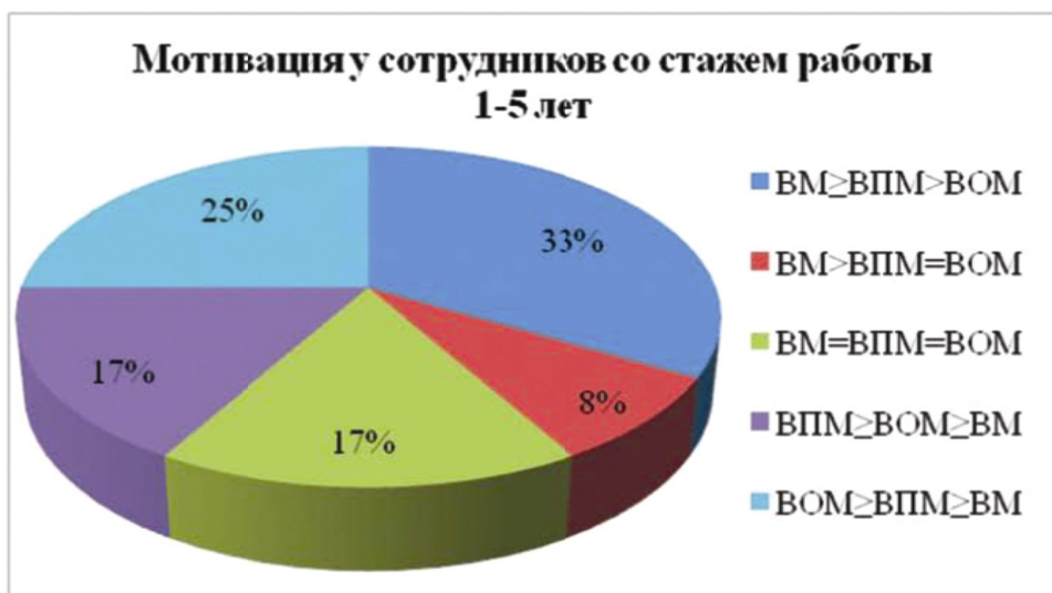
Рис.1 - Соотношение видов мотивации у сотрудников патрульно-постовой службы со стажем работы 1-5 лет.

положительная и внешняя отрицательная мотивация равны ( BM=ВПМ=ВОМ ). Еще у 4 респондентов - внешняя положительная мотивация \geq внешней отрицательной \geq внутренней мотивации ( ВПМ\geq ВОМ\geq BM ). У 6 человек наблюдается, что внешняя отрицательная мотивация \geq внешней положительной мотивации \geq внутренней мотивации ( ВОМ\geq ВПМ\geq BM ).