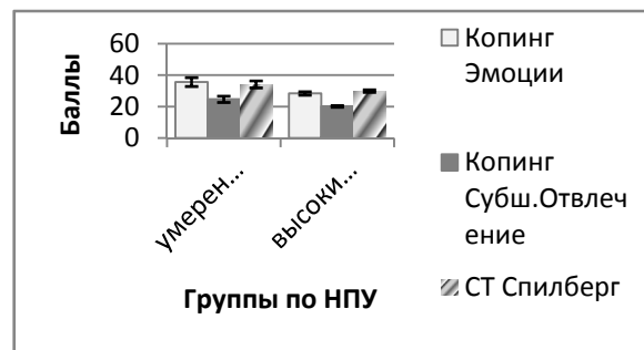
Рис. 1 - Степень выраженности Кэ, Кo и СТ в группах пожарных по НПУ.

от копинг-поведения, ориентированного на эмоции ( p = 0,02 ) и на отвлечение ( p = 0,01 ), а также от ситуативной тревожности ( p = 0,08 ). Степень выраженности этих показателей в группах по НПУ представлена на рис. 1.