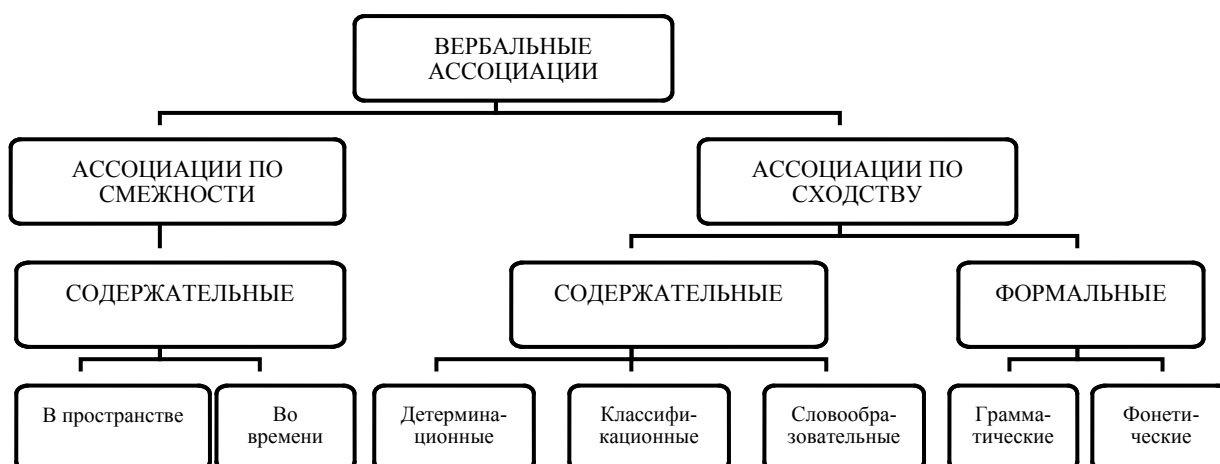
Рис. 1.1. Классификация вербальных ассоциаций (Мартинович, 1977).

Однако и эта классификация не решает вопроса качественного анализа ассоциаций: учитывая смысловые и грамматические аспекты порождения ассоциаций, она не включает психологические, прежде всего, эмоциональные причины их возникновения.